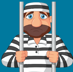
Экстремизму - нет!

ст. 354.1 Реабилитация нацизма наказываются штрафом до 500 тысяч рублей, лишением свободы до 5 лет.